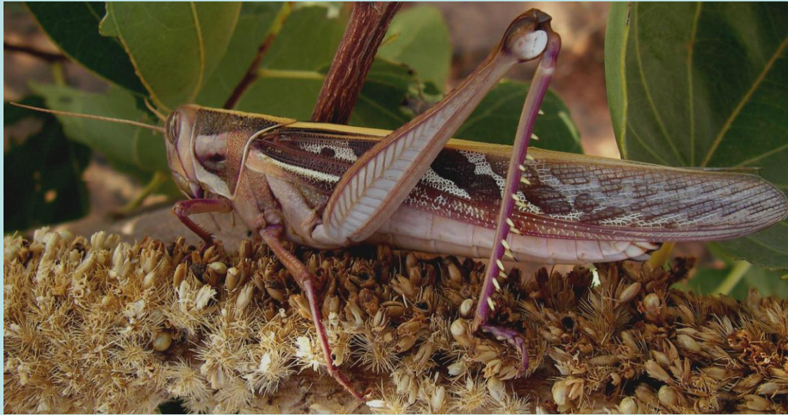
Ornithacris turbida cavroisi (Finot, 1907). Orthoptère, Acrididae, Cyrtacanthacridinae