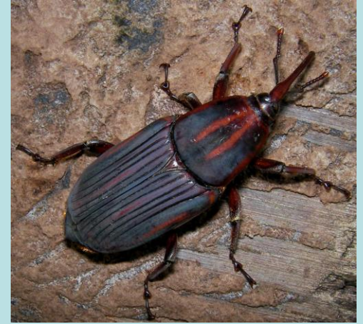
Rhynchophorus phoenicis F. Coléoptère, Curculionidae.