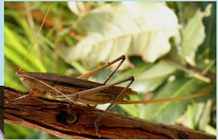
Ruspolia sp. Orthoptère, Acrididae Tettigoniidae