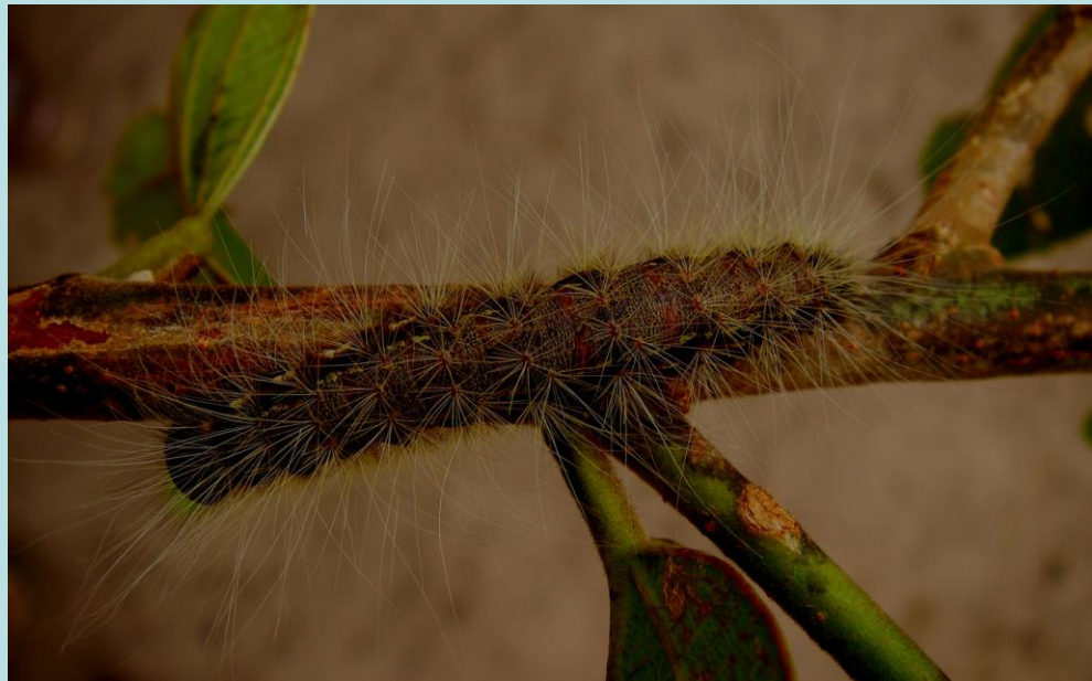
Anaphe panda , Lépidoptère, Notodontidae