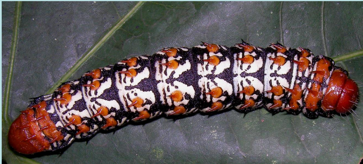
Imbrasia sp. Lépidoptère, Saturniidae