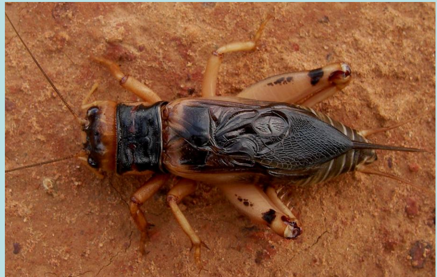
Brachytrupes membranaceus Drury. Orthoptère, Grillydae