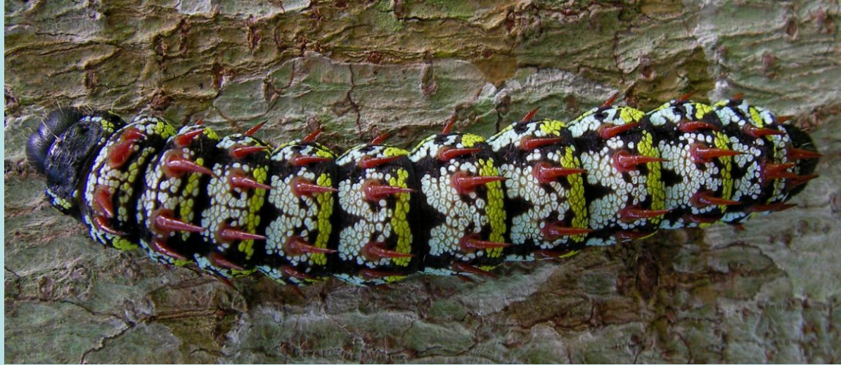
Imbrasia oyemensis . Lépidoptère, Saturniidae