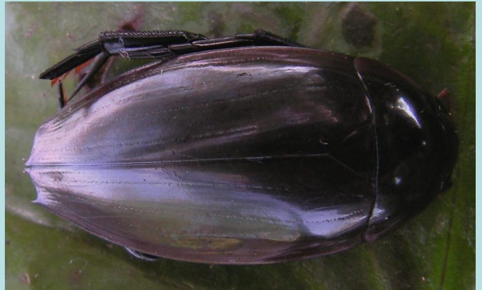
Hydrophilus sp. Coléoptère, Hydrophilidae