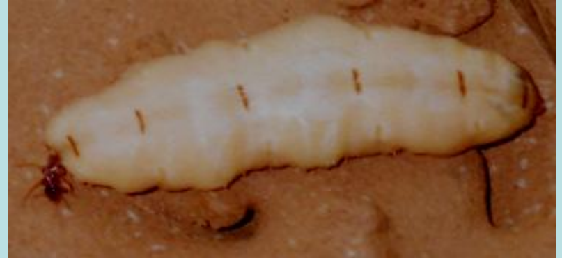
Macrotermes falciger Gerstacker. Isoptère, Termitidae