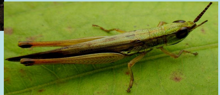
Tristria sp. Orthoptère, Acrididae Tropidopolinae