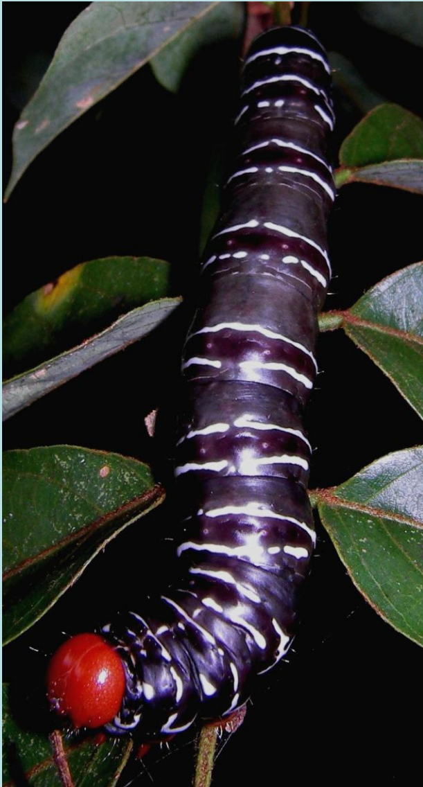
Antheua sp. Lépidoptère, Notodontidae