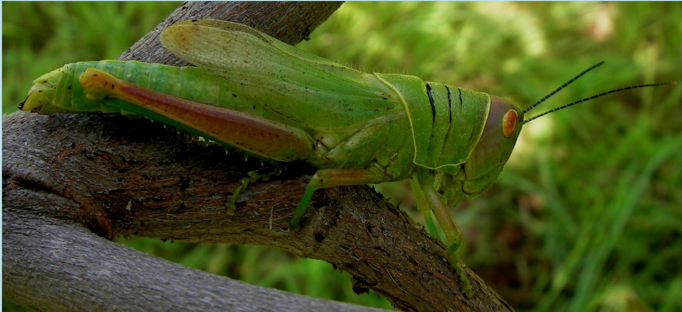
Hieroglyphus africanus Uvarov, 1922. Orthoptère, Acrididae Hemiacridinae