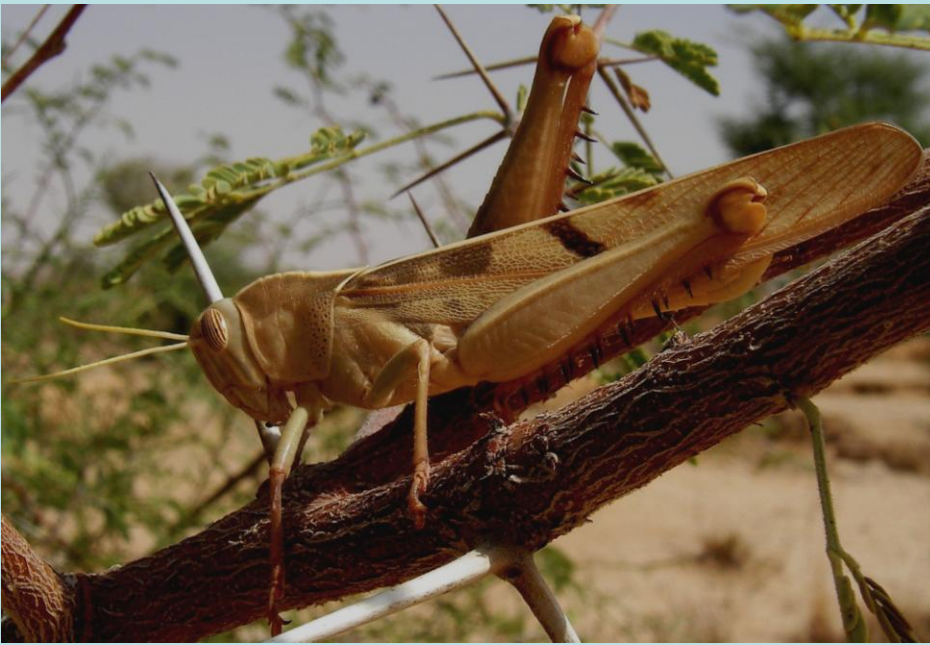
Acanthacris ruficornis citrina (Audinet-Serville, 1838). Orthoptère, Acrididae Cyrtacanthacridinae