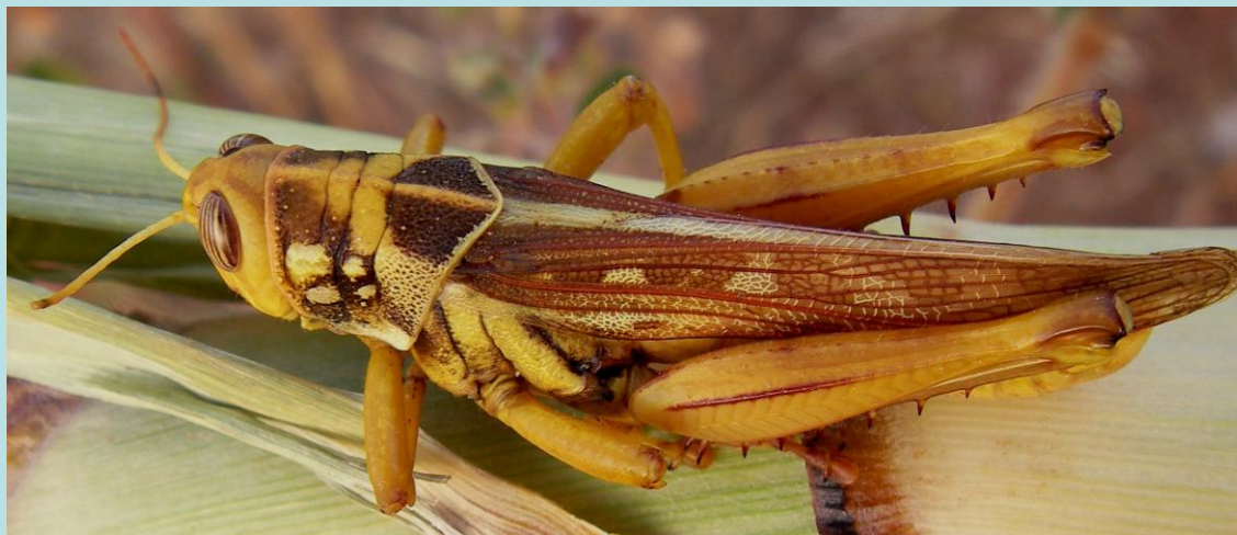
Kraussaria angulifera (Krauss, 1877). Orthoptère, Acrididae Cyrtacanthacridinae