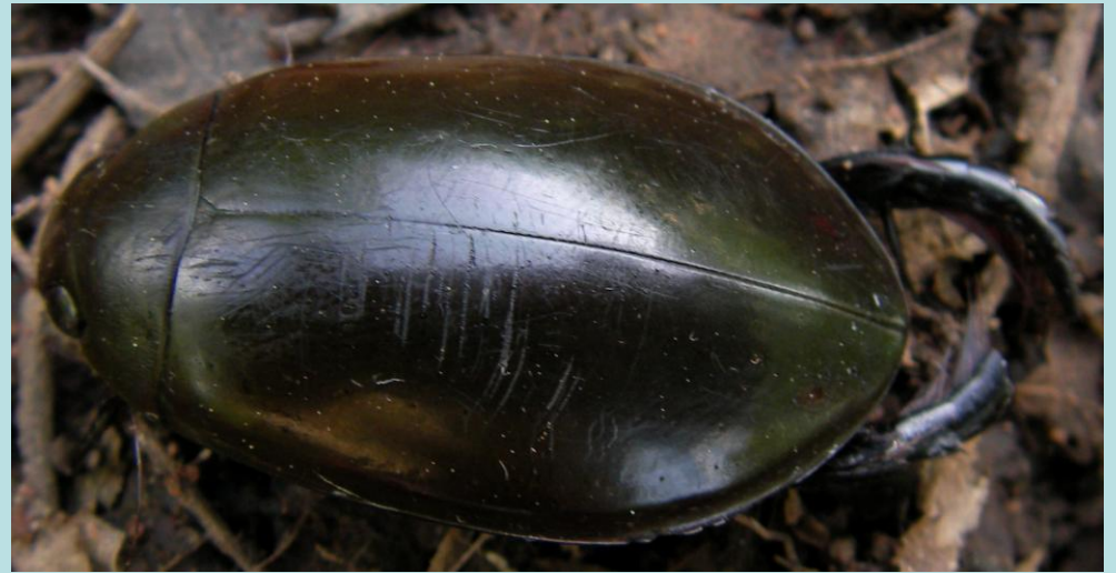
Cybister sp. Coléoptère, Dytiscidae