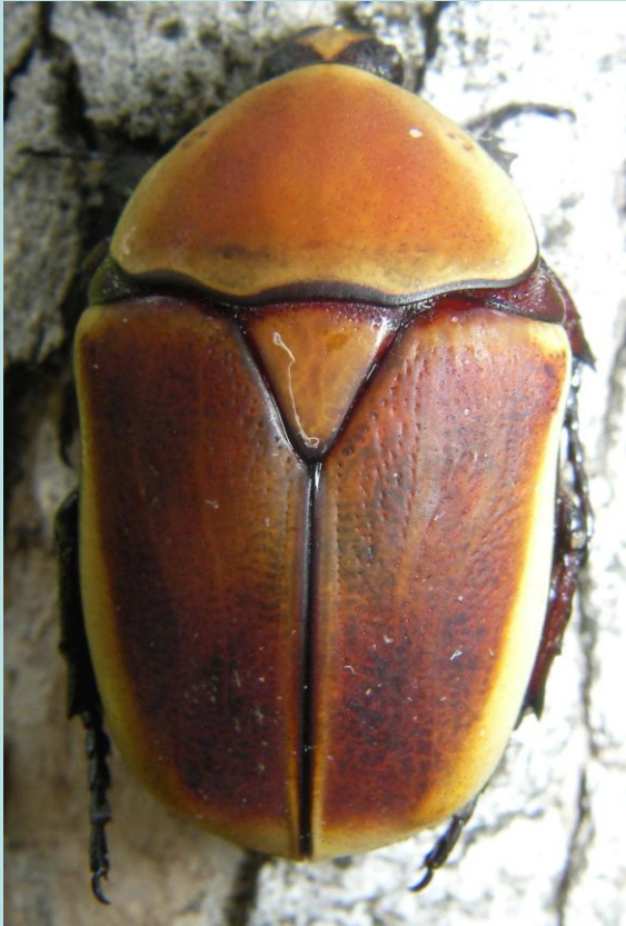
Pachnoda marginata aurantia. Coléoptère, Scarabaeidae, Cetoniinae