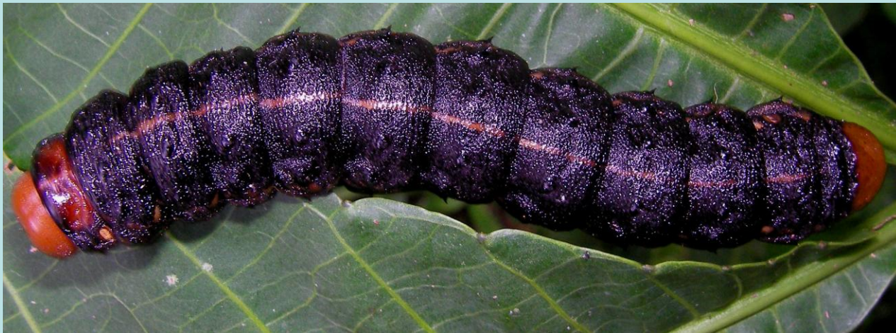
Imbrasia epimethea Drury. Lépidoptère, Saturniidae