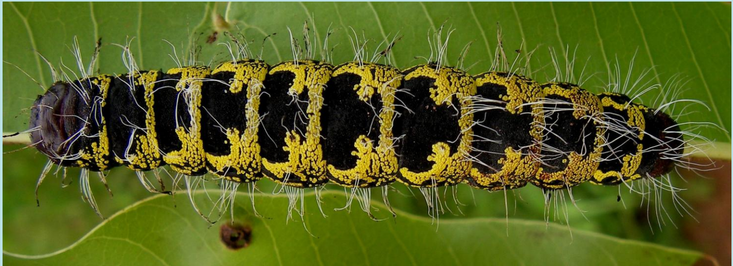
Cirina forda (Westwood). Lépidoptère, Saturniidae