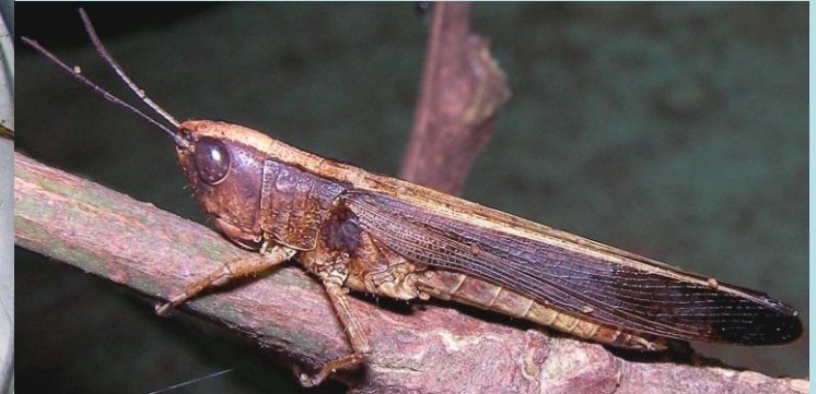
Coryphosima stenoptera (Schaum, 1853), Orthoptère, Acridinae