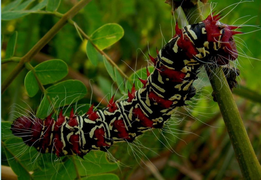
Imbrasia obscura Butler. Lépidoptère, Saturniidae