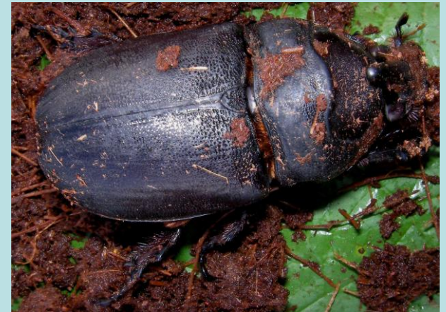
Oryctes spp. Coléoptère , Dynastidae