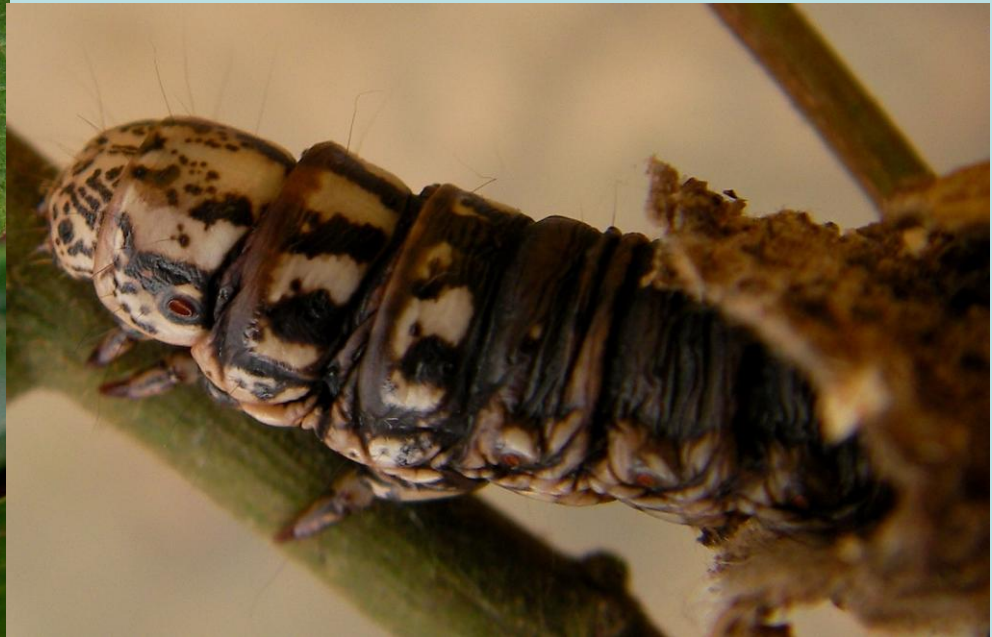
Eumeta sp. Lépidoptère, Psychidae.