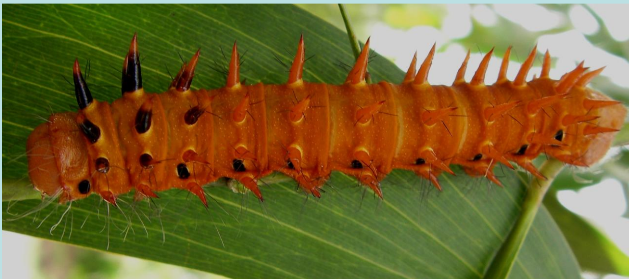
Imbrasia alopia Westwood. Lépidoptère, Saturniidae