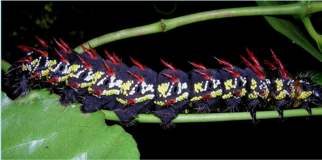
Imbrasia sp. Lépidoptère, Saturniidae